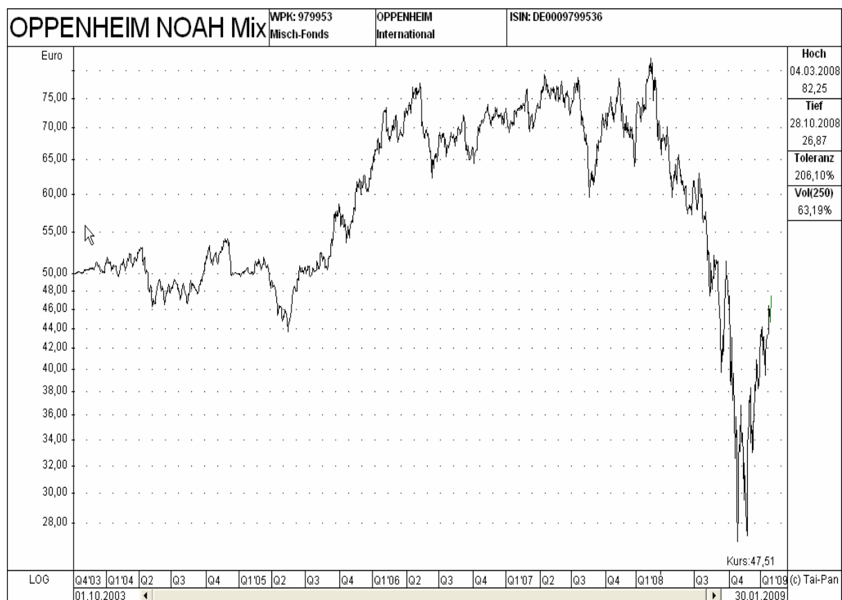
Abb. 1: Kursentwicklung des NOAH-Mix OP (979 953) von 01.10.2003 bis 31.01.2009

Angesichts der Zunahme wirtschaftlicher und politischer Unwägbarkeiten bietet der Fonds durch seine benchmarkunabhängige Flexibilität mit dem aktuellen Schwerpunkt auf Rohstoffaktien die Möglichkeit eines stetigen Wachstums und eignet sich somit hervorragend zur langfristigen Anlage. Das Sondervermögen NOAH-Mix OP weist aufgrund seiner Zusammensetzung eine erhöhte Volatilität auf, d.h. die Anteilspreise können auch innerhalb kurzer Zeiträume erheblichen Schwankungen nach oben und nach unten unterworfen sein.