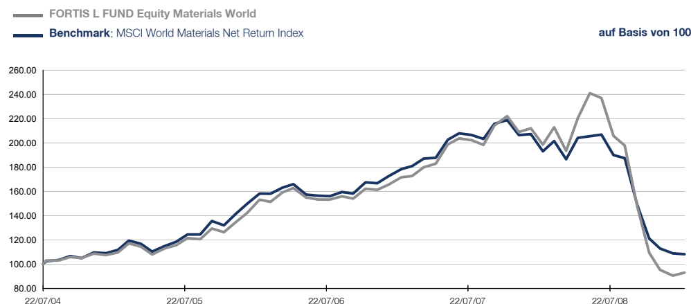
Anteilspreise (NAV) und Erträge vor dem 24/11/2008 beziehen sich auf die Wertentwicklung des früheren AAF Materials Fund. Sie sind kein Hinweis auf zukünftige Erträge. Quelle: Fortis Investments (ohne Gebühren)