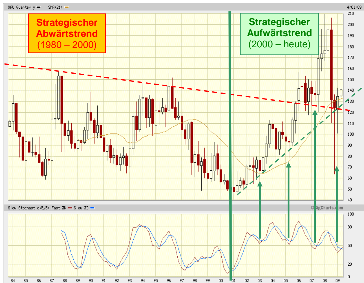
Abb. 3: XAU-Gold-&Silberminenindex auf Quartalsbasis vom 4. Quartal 1983 bis zum 1. Quartal 2009

Der kommende „Geldentwertungstsunami“ wird nicht inflationsgeschützte Investments implodieren und Edelmetallinvestments explodieren lassen. Jedoch wurden, entgegen unserer Empfehlung, viele Kleinanleger – animiert von „Tradingspezialisten“ – zu Tiefkursen aus dem Markt gedrängt. Sie verkauften ihre Goldminenanteile zu Spottpreisen an die smart akkumulierenden Großinvestoren ( http://www.minenportal.de/artikel.php?sid=5271 ). Alles was in den letzten drei Quartalen abgelaufen ist, war eine gigantische Umverteilung, die nun vor ihrem Ende steht. So richtig klar wird dies besonders, bei der Betrachtung des XAU-Gold-&Silberminenindex auf Quartalsbasis (siehe hierzu Abb. 3). Durch diese langfristig strategische Betrachtung blendet man das tagtägliche „Marktrauschen“ aus. Außerdem handeln besonders Großinvestoren, die nachhaltig Kurse bewegen, aufgrund auslaufender Terminkontrakte und Schließung der Bücher, verstärkt zum Quartalsende.