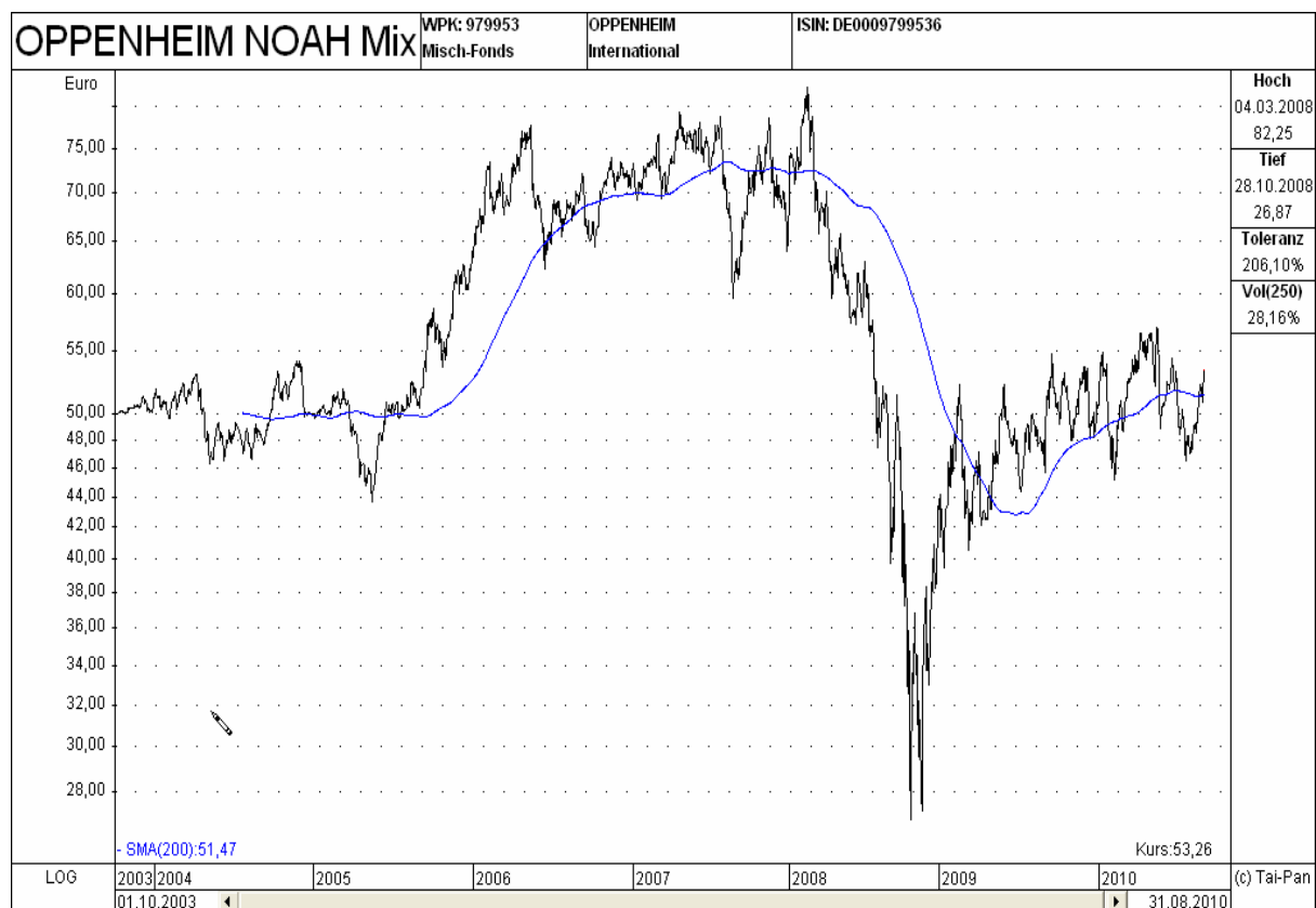
Abb. 1: Kursentwicklung des NOAH-Mix OP (979 953) von 01.10.2003 bis 31.08.2010

Das Sondervermögen NOAH-Mix OP weist aufgrund seiner Zusammensetzung eine erhöhte Volatilität auf, d.h. die Anteilspreise können auch innerhalb kurzer Zeiträume erheblichen Schwankungen nach oben und nach unten unterworfen sein. Zu den Risiken zählen insbesondere Adressausfall-, Zinsänderungs-, Währungs- sowie sonstige Marktpreisrisiken, operationelle Risiken und Liquiditätsrisiken.