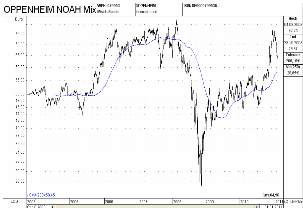
Abb. 1: Kursentwicklung des NOAH-Mix OP (979 953) von 01.10.2003 bis 31.01.2011

Das Sondervermögen NOAH-Mix OP weist aufgrund seiner Zusammensetzung eine erhöhte Volatilität auf, d.h. die Anteilspreise können auch innerhalb kurzer Zeiträume erheblichen Schwankungen nach oben und nach unten unterworfen sein. Zu den Risiken zählen insbesondere Adressausfall-, Zinsänderungs-, Währungs- sowie sonstige Marktpreisrisiken, operationelle Risiken und Liquiditätsrisiken.