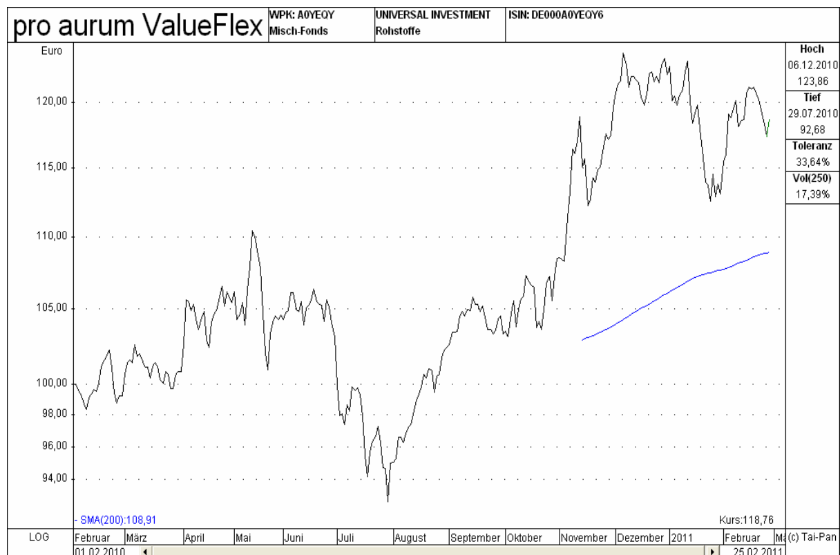
Abb. 1: Kursentwicklung des pro aurum ValueFlex (A0YEQY) von 01.02.2010 bis 28.02.2011

Das Sondervermögen pro aurum ValueFlex weist aufgrund seiner Zusammensetzung eine erhöhte Volatilität auf, d.h. die Anteilspreise können auch innerhalb kurzer Zeiträume erheblichen Schwankungen nach oben und nach unten unterworfen sein. Zu den Risiken zählen insbesondere Adressausfall-, Zinsänderungs-, Währungs- sowie sonstige Marktpreisrisiken, operationelle Risiken und Liquiditätsrisiken.