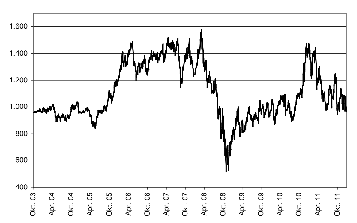
Abb. 1: Wertentwicklung unter Einbeziehung aller fondsinternen Kosten sowie des Ausgabeaufschlages bei Erstanlage. Individuelle Kosten wie Depotgebühren sind nicht berücksichtigt. Unter Einbeziehung dieser Kosten würde die Wertentwicklung niedriger ausfallen. Berechnet gemäß Bundesverband Investment und Asset Management e.V. (BVI).