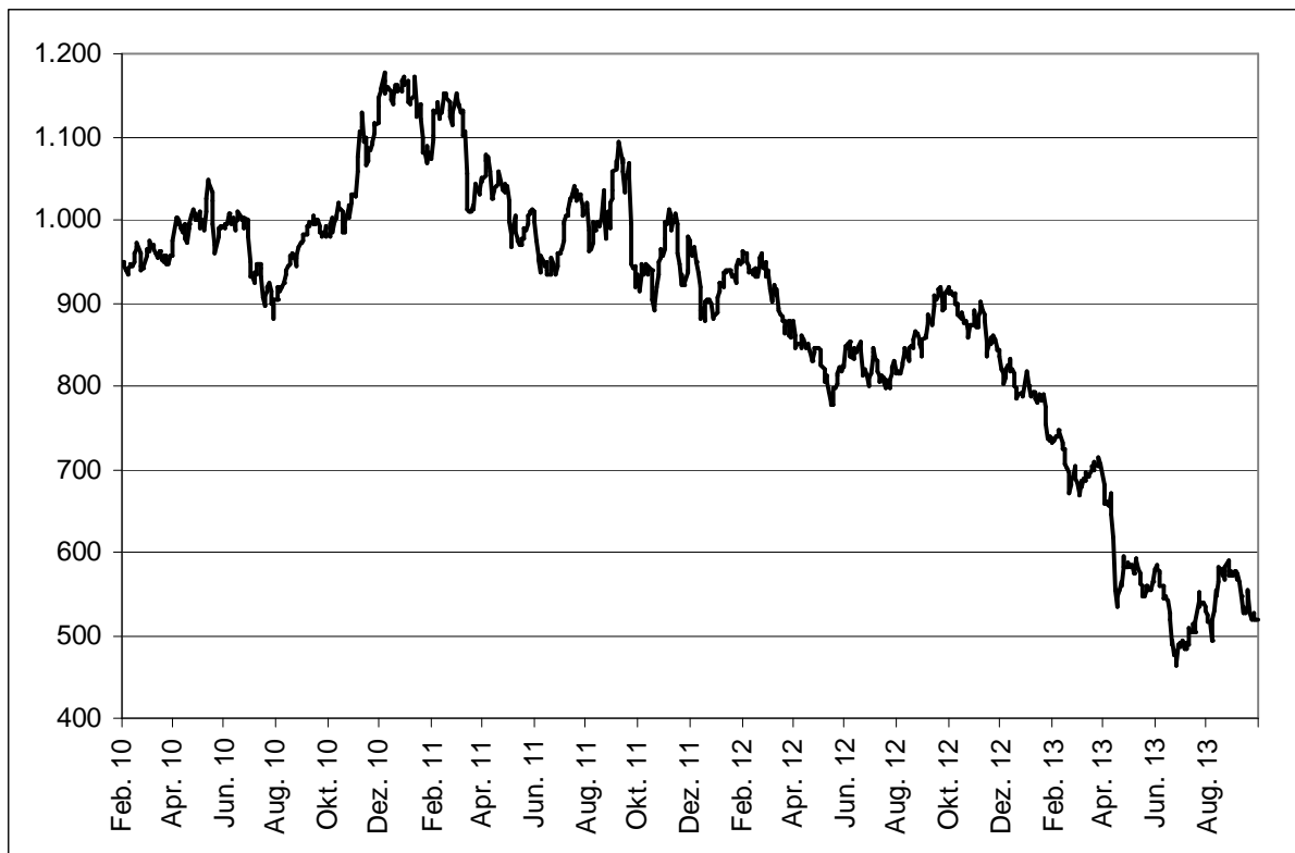
Abb. 1: Wertentwicklung unter Einbeziehung aller fondsinternen Kosten sowie des Ausgabeaufschlages bei Erstanlage. Individuelle Kosten wie Depotgebühren sind nicht berücksichtigt. Unter Einbeziehung dieser Kosten würde die Wertentwicklung niedriger ausfallen. Berechnet gemäß Bundesverband Investment und Asset Management e.V. (BVI).