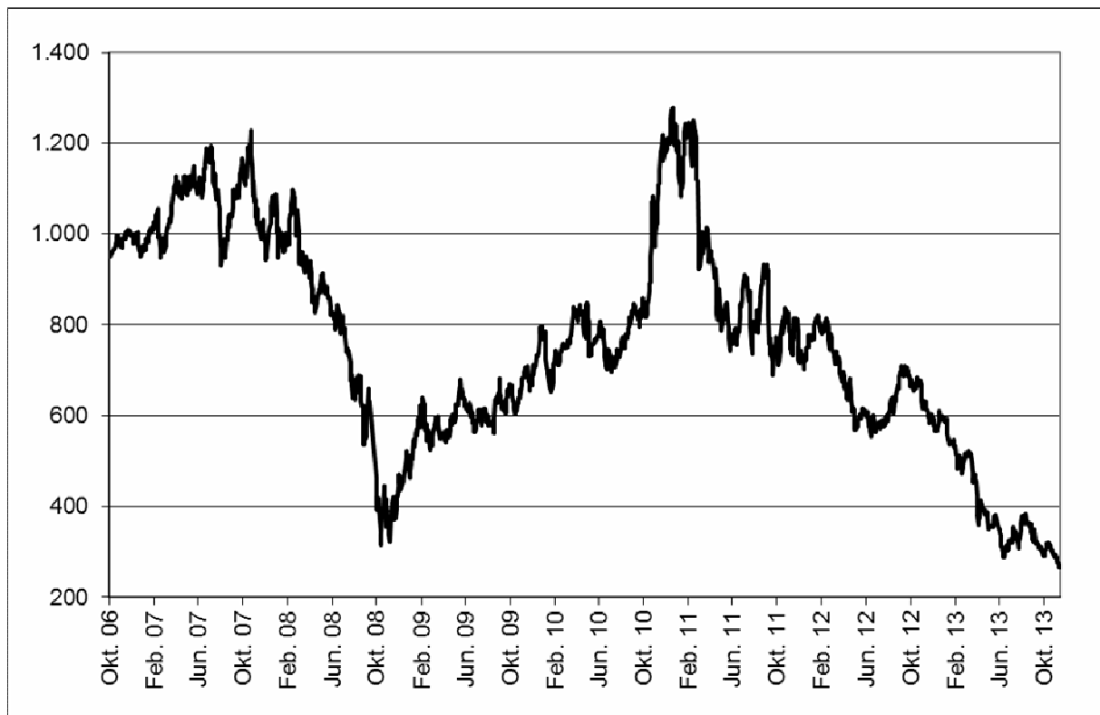
Abb. 1: Wertentwicklung unter Einbeziehung aller fondsinternen Kosten sowie des Ausgabeaufschlages bei Erstanlage. Individuelle Kosten wie Depotgebühren sind nicht berücksichtigt. Unter Einbeziehung dieser Kosten würde die Wertentwicklung niedriger ausfallen. Berechnet gemäß Bundesverband Investment und Asset Management e.V. (BVI).