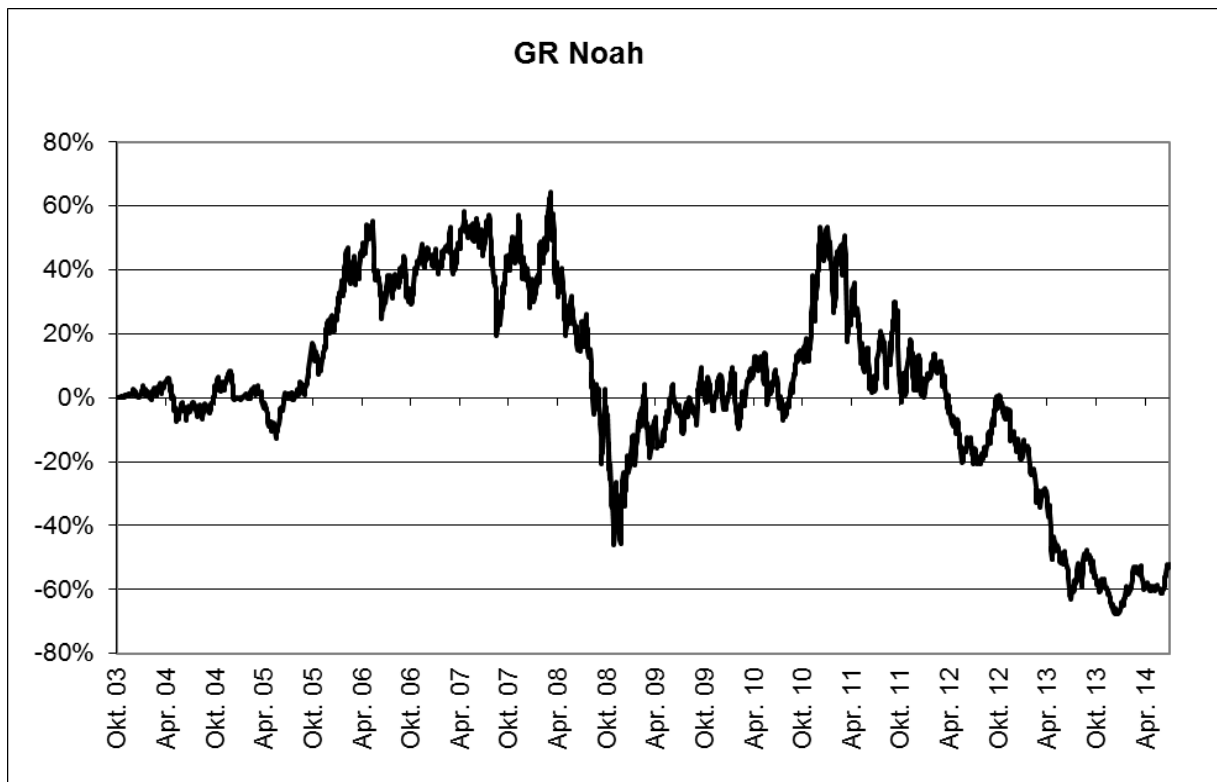
Abb. 2: Die Datenreihe zeigt die Wertentwicklung des GR Noah vom 01.10.2003 bis zum 30.06.2014. Die Wertentwicklung in der Vergangenheit ist kein Indikator für die zukünftige Wertentwicklung und keine Garantie für einen Erfolg in der Zukunft.