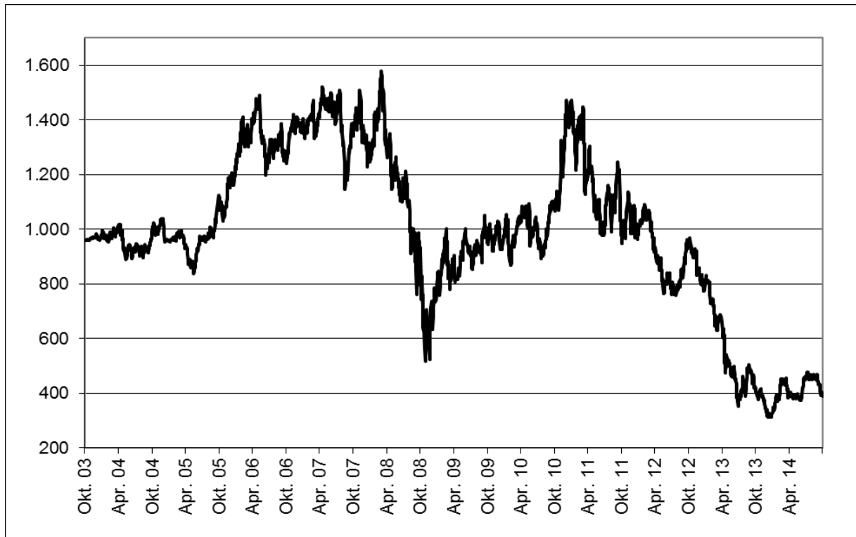
Abb. 1: Wertentwicklung unter Einbeziehung aller fondsinternen Kosten sowie des Ausgabeaufschlages bei Erstanlage. Individuelle Kosten wie Depotgebühren sind nicht berücksichtigt. Unter Einbeziehung dieser Kosten würde die Wertentwicklung niedriger ausfallen. Berechnet gemäß Bundesverband Investment und Asset Management e.V. (BVI).