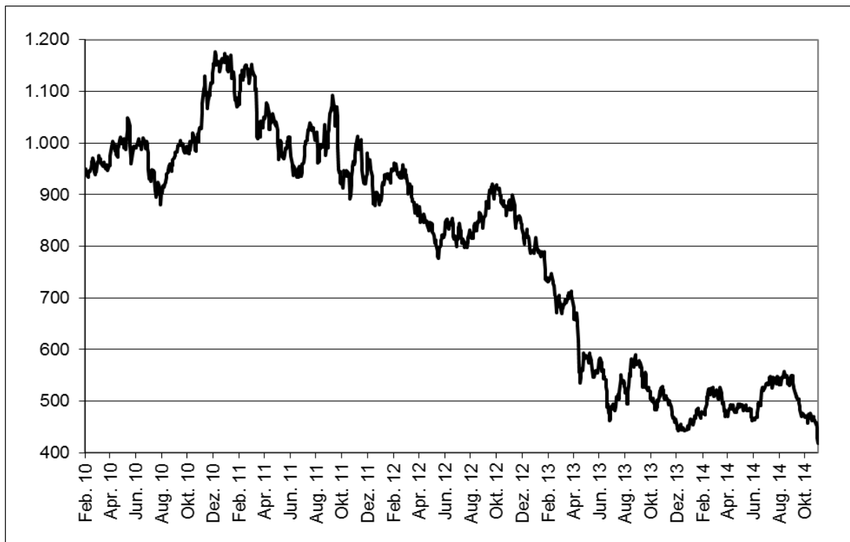
Abb. 1: Wertentwicklung unter Einbeziehung aller fondsinternen Kosten sowie des Ausgabeaufschlages bei Erstanlage. Individuelle Kosten wie Depotgebühren sind nicht berücksichtigt. Unter Einbeziehung dieser Kosten würde die Wertentwicklung niedriger ausfallen. Berechnet gemäß Bundesverband Investment und Asset Management e.V. (BVI).