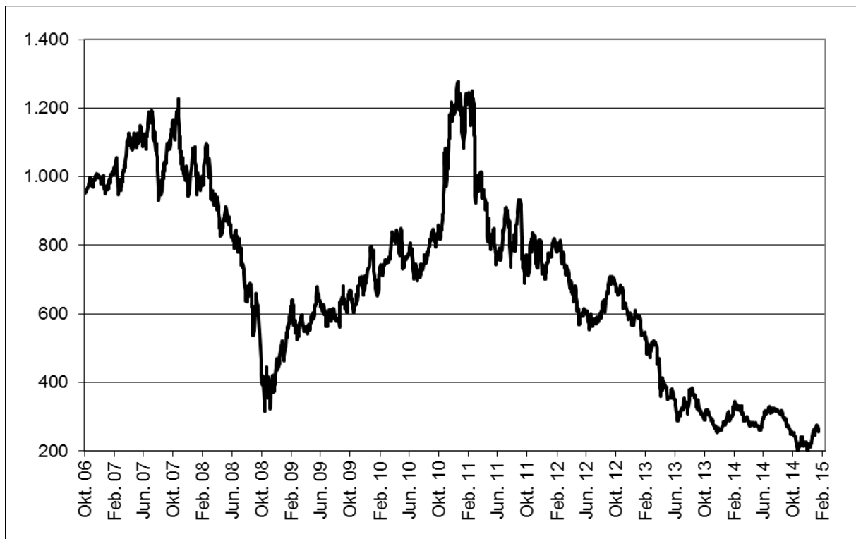
Abb. 1: Wertentwicklung unter Einbeziehung aller fondsinternen Kosten sowie des Ausgabeaufschlages bei Erstanlage. Individuelle Kosten wie Depotgebühren sind nicht berücksichtigt. Unter Einbeziehung dieser Kosten würde die Wertentwicklung niedriger ausfallen. Berechnet gemäß Bundesverband Investment und Asset Management e.V. (BVI).