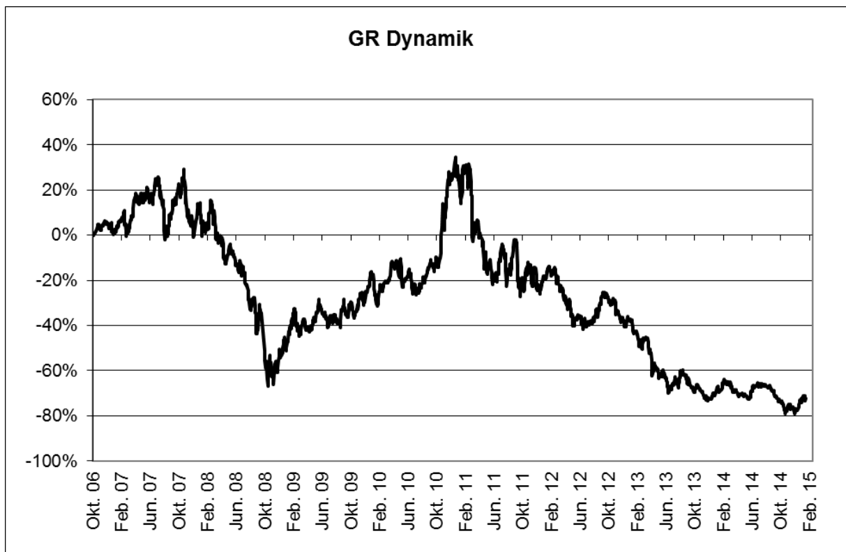
Abb. 2: Die Datenreihe zeigt die Wertentwicklung des GR Dynamik vom 16.10.2006 bis zum 31.01.2015. Die Wertentwicklung in der Vergangenheit ist kein Indikator für die zukünftige Wertentwicklung und keine Garantie für einen Erfolg in der Zukunft.