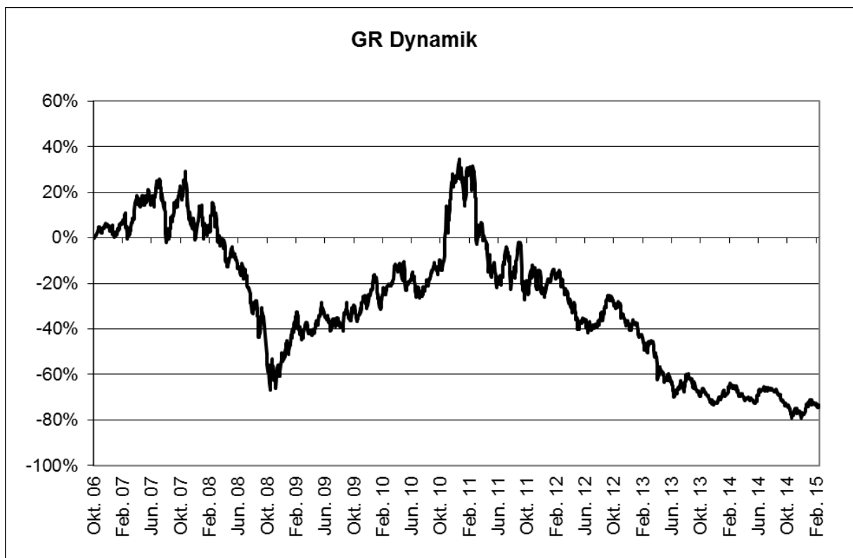
Abb. 2: Die Datenreihe zeigt die Wertentwicklung des GR Dynamik vom 16.10.2006 bis zum 28.02.2015. Die Wertentwicklung in der Vergangenheit ist kein Indikator für die zukünftige Wertentwicklung und keine Garantie für einen Erfolg in der Zukunft.