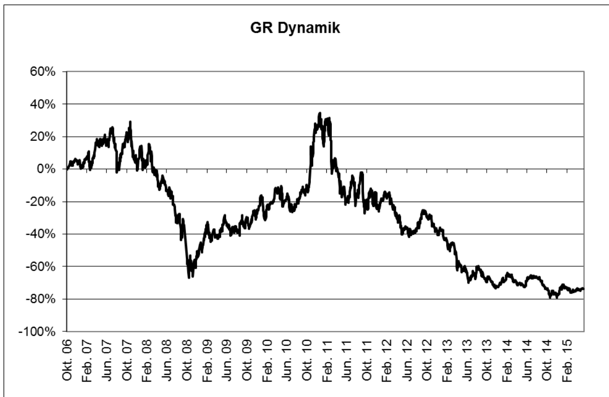
Abb. 2: Die Datenreihe zeigt die Wertentwicklung des GR Dynamik vom 16.10.2006 bis zum 31.05.2015. Die Wertentwicklung in der Vergangenheit ist kein Indikator für die zukünftige Wertentwicklung und keine Garantie für einen Erfolg in der Zukunft.