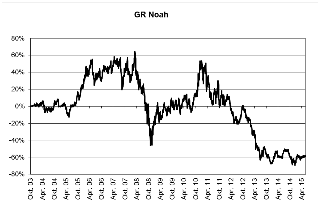
Abb. 2: Die Datenreihe zeigt die Wertentwicklung des GR Noah vom 01.10.2003 bis zum 31.05.2015. Die Wertentwicklung in der Vergangenheit ist kein Indikator für die zukünftige Wertentwicklung und keine Garantie für einen Erfolg in der Zukunft.