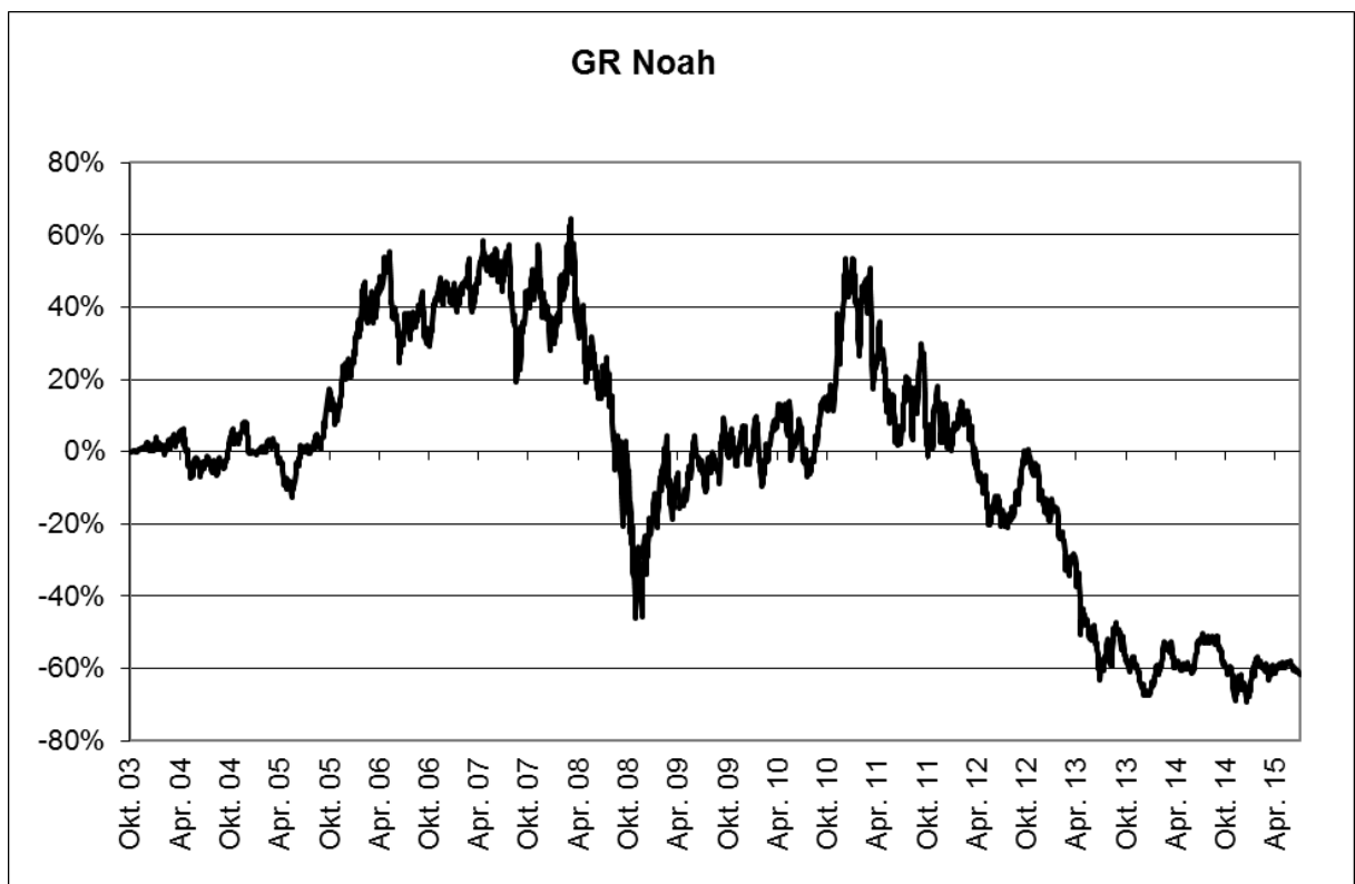
Abb. 2: Die Datenreihe zeigt die Wertentwicklung des GR Noah vom 01.10.2003 bis zum 30.06.2015. Die Wertentwicklung in der Vergangenheit ist kein Indikator für die zukünftige Wertentwicklung und keine Garantie für einen Erfolg in der Zukunft.