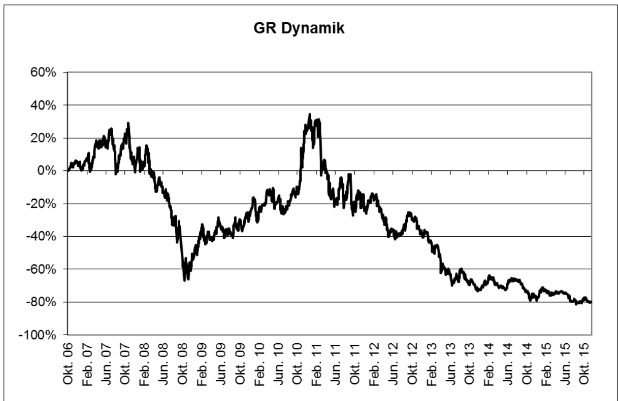
Abb. 2: Die Datenreihe zeigt die Wertentwicklung des GR Dynamik vom 16.10.2006 bis zum 30.11.2015. Die Wertentwicklung in der Vergangenheit ist kein Indikator für die zukünftige Wertentwicklung und keine Garantie für einen Erfolg in der Zukunft.