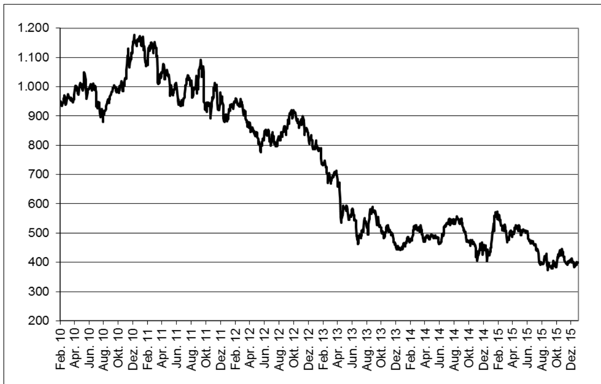
Abb. 1: Wertentwicklung unter Einbeziehung aller fondsinternen Kosten sowie des Ausgabeaufschlages bei Erstanlage. Individuelle Kosten wie Depotgebühren sind nicht berücksichtigt. Unter Einbeziehung dieser Kosten würde die Wertentwicklung niedriger ausfallen. Berechnet gemäß Bundesverband Investment und Asset Management e.V. (BVI).